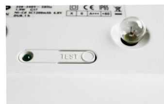
Bouton de test intégré

Adhésif pour la signalisation de la sortie inclus